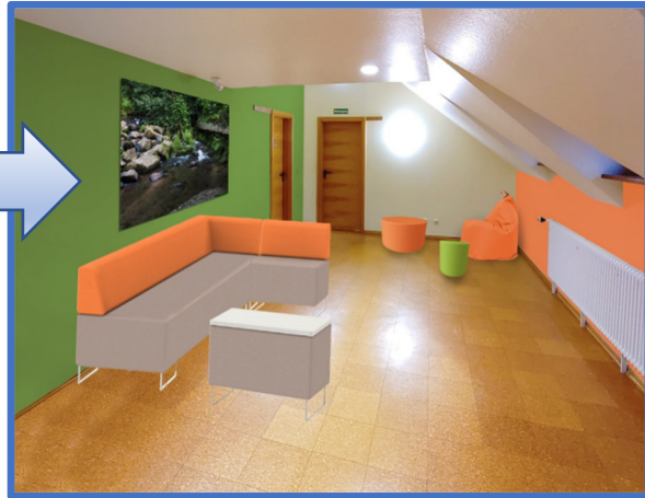
Akademie im DG – Vorraum zum Bayernsaal