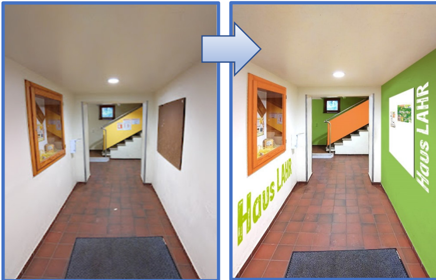
Eingangsbereich im Tiefgeschoss

Im Innenbereich (erste Planungen; Farbgestaltung nicht festgelegt)