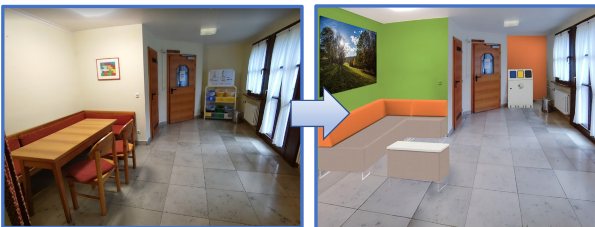
Aufenthaltsbereich im 1. und 2. OG